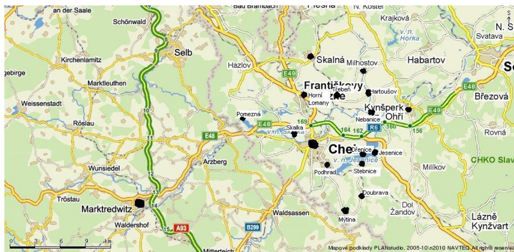
Obrázek 1 Mapa okolí Chebu

Body zakreslené na mapě č. 1 referenčně ukazují na spojitost mezi trasami těchto výše uvedených cest a v případech popsanych v Knize klateb. Jedná se o tyto místa Doubrava, Dřenice, Hartoušov, Horní Lomany, Cheb, Jesenice, Kynšperk, Milhostov, Marktredwitz, Mýtina, Nebanice, Podhrad, Pomezná, Skalka, Skalná, Stebnice a Třebeň.