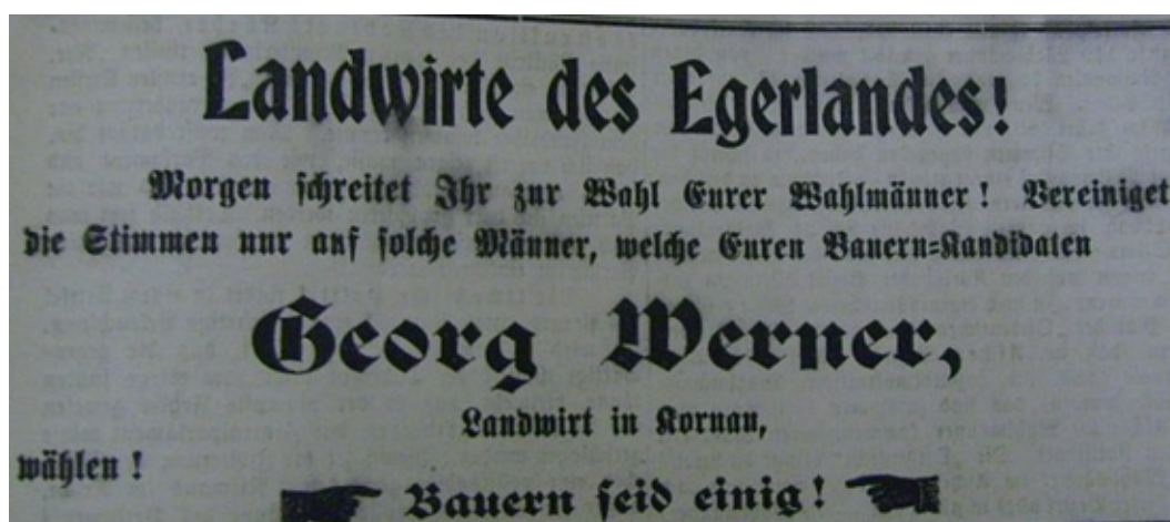
Obrázek 4: Výzva pro voliče venkovského obvodu z roku 1900