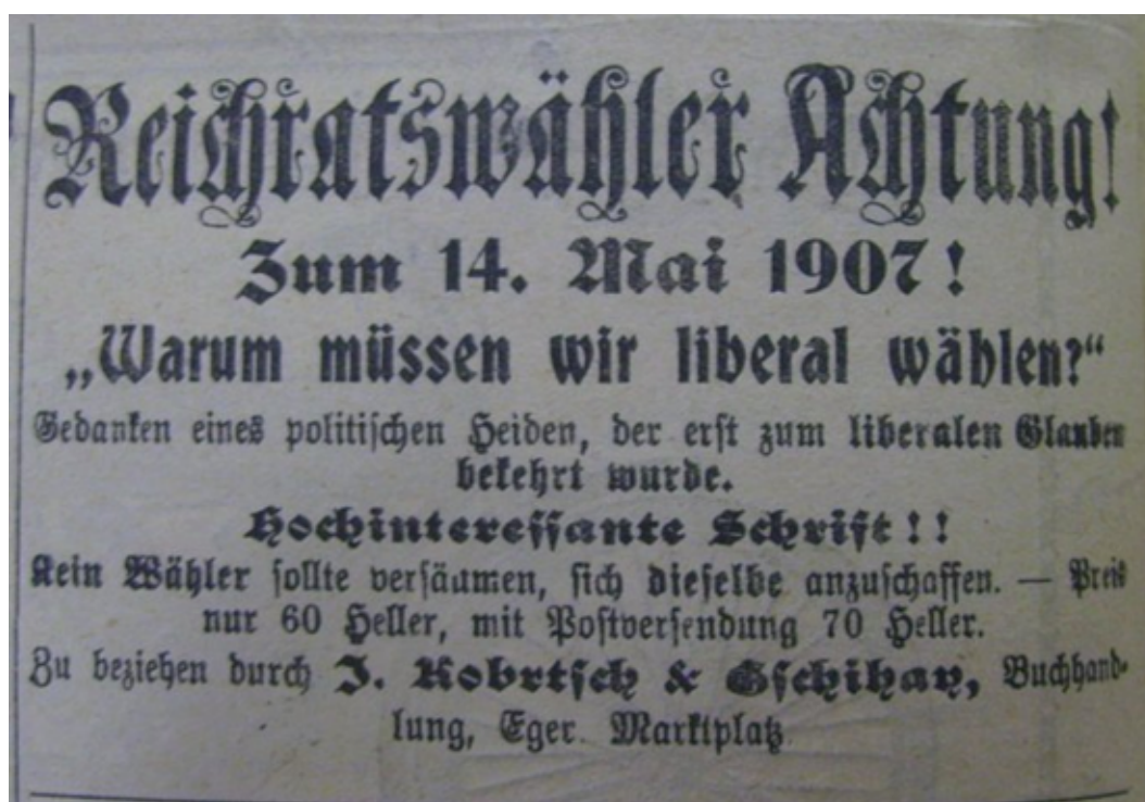
Obrázek 5: Ukázka reklamy na knihu „Proč musíme volit liberály“ z roku 1907