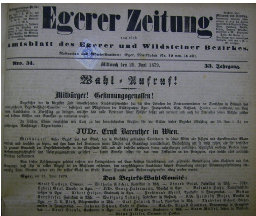
Obrázek 3: Výzva k volbám z roku 1879